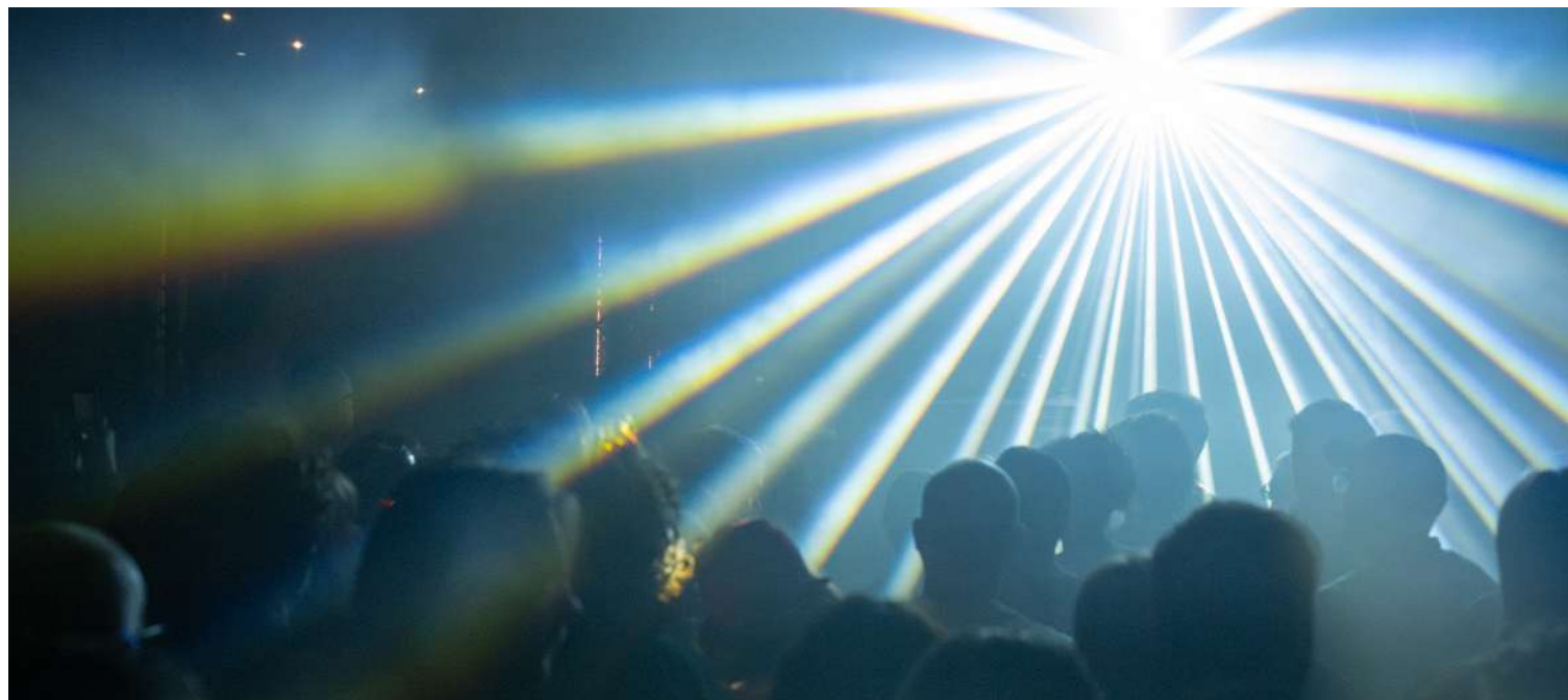
Closer Music, 2025